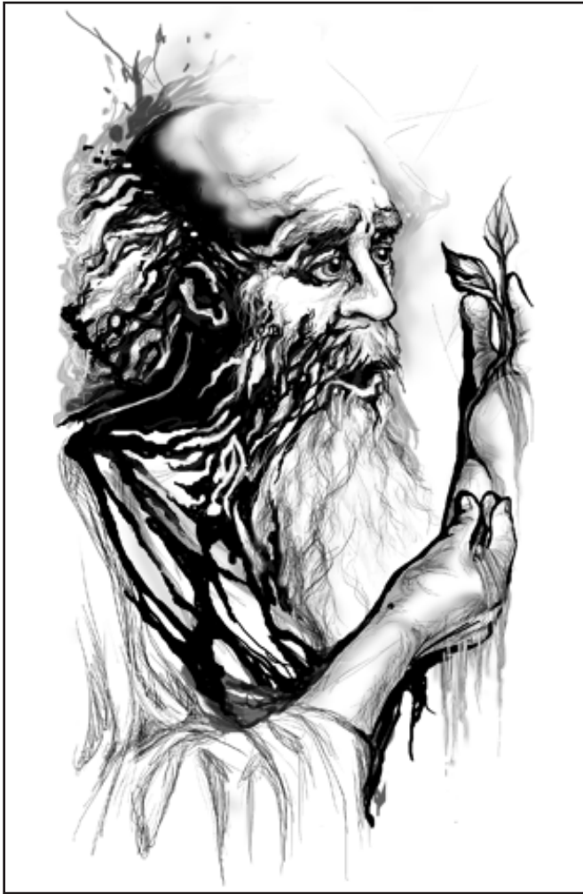
Illustration publiée: Épictète