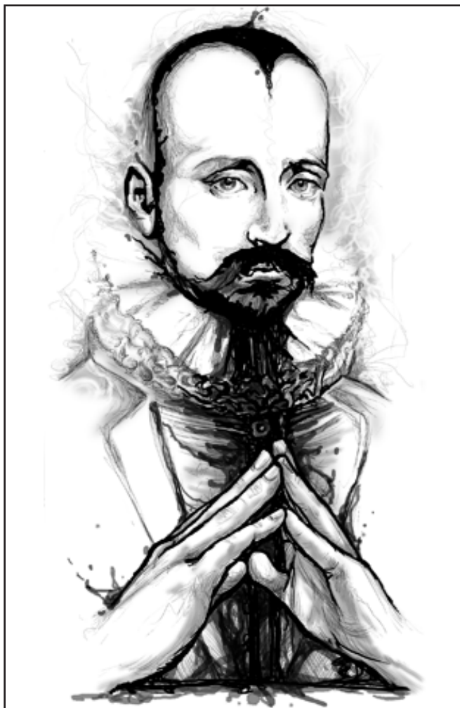
Illustration publiée : Montaigne

Pour illustrer cette volonté de ne jamais dévier, j'ai choisi de placer toutes les lignes de force au centre du dessin, de façon à asseoir la composition sur l'espace situé entre les mains. Ce procédé confère au personnage une attitude de détachement et de réflexion qui sied à cet homme contemplatif. Le visage de Montaigne est à l'image de sa façon de vivre : lisse, des traits ouverts et égaux sans trace d'excès d'aucune sorte; Son regard exprime la douceur et la compassion. Un aspect de sa pensée m'a particulièrement touché : l'importance qu'il accordait aux bonnes relations interpersonnelles, qu'il considérait comme une grande richesse. J'ai exprimé ceci à travers la position des mains qui se rejoignent au centre; les doigts unis par leur extrémité représentent les liens interpersonnels, dans une attitude d'ouverture paisible.