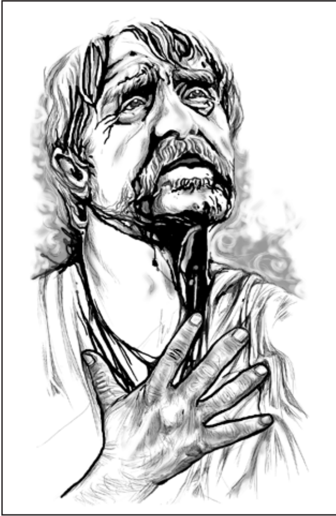
Illustration publiée: Sénèque

ci et la main, pour faire de cette partie le pivot central de l'image. Sénèque mentionne également que l'humilité fait partie de la dignité, qu'un homme qui sait donner doit aussi savoir recevoir. Puisque chaque homme se voit confier à sa naissance une mission à remplir, nul n'est trop grand pour demander assistance; refuser par orgueil une aide généreusement offerte peut compromettre l'accomplissement de la tâche. J'ai élevé son regard vers le ciel en un geste de prière en le plaçant en contre-plongée, pour illustrer le fait que savoir demander ou accepter les dons n'a rien d'une humiliation; qu'il s'agit plutôt d'une autre façon d'exprimer sa grandeur.