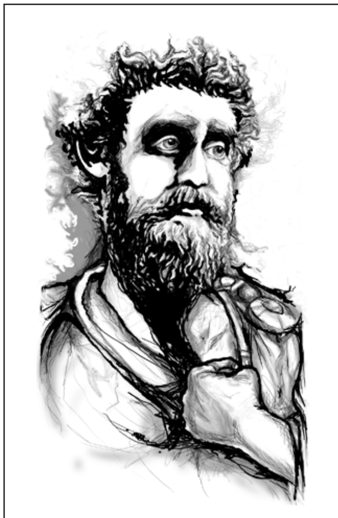
Illustration publiée: Marc-Aurèle

D'épictète, qui savait puiser au sein de l'épreuve les ressources nécessaires pour la franchir, j'ai principalement retenu les phrases suivantes: «L'aptitude à laisser couler les choses qui ne dépendent pas de moi; l'acceptation des événements tels qu'ils se présentent; l'habileté à tirer avantage de ce qui arrive». Ces pensées m'évoquent la force inéluctable de l'eau qui, tout doucement, en s'écoulant jour après jour, finit par percer le roc le plus solide.